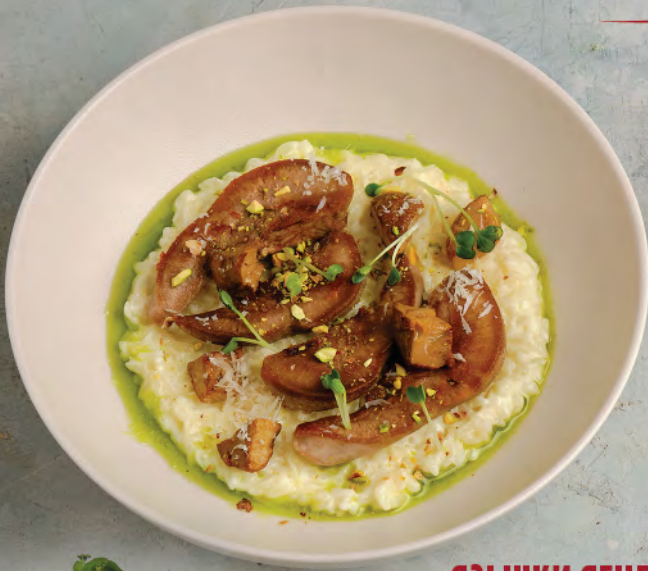
ЯЗЫЧКИ ЯГНЕНКА с ризотто из булгура