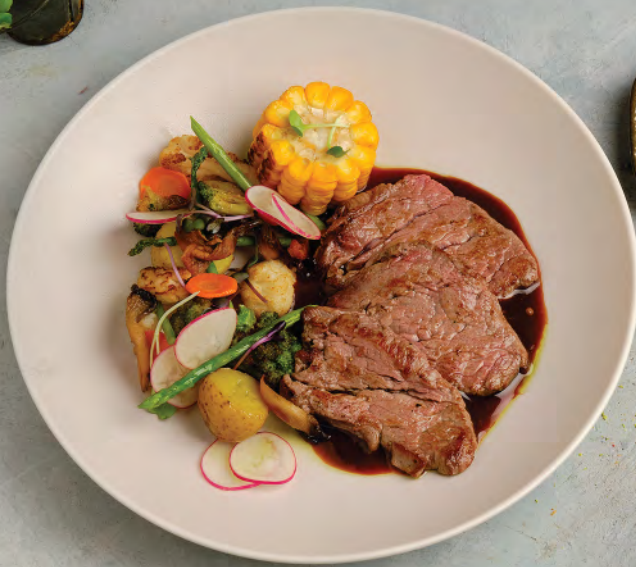
МЕДАЛЬОНЫ ИЗ ТЕЛЯТИНЫ